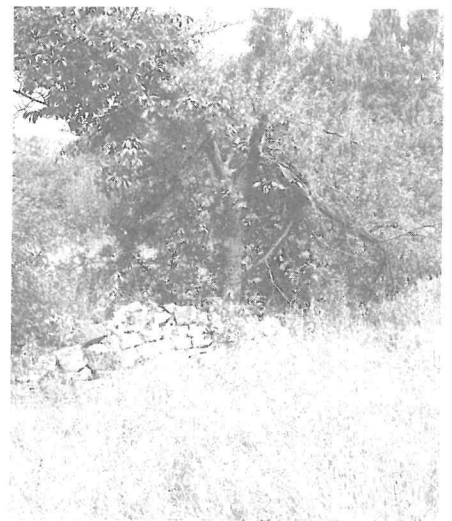
WIESEN MIT ALTEN OBSTBÄUMEN, Steinhaufen mit vielen Hohlräumen und Wechsel von Gebüsch und Wiesen bilden ein vielfältiges Mosaik von Kleinlebensräumen. Aufgrund der geschützten Lage und der freien Verbindung zu den Feldfluren zwischen Gostritz und Bannewitz ist dieses Flächennaturdenkmal ein wertvolles Rückzugsgebiet im Dresdner Süden.