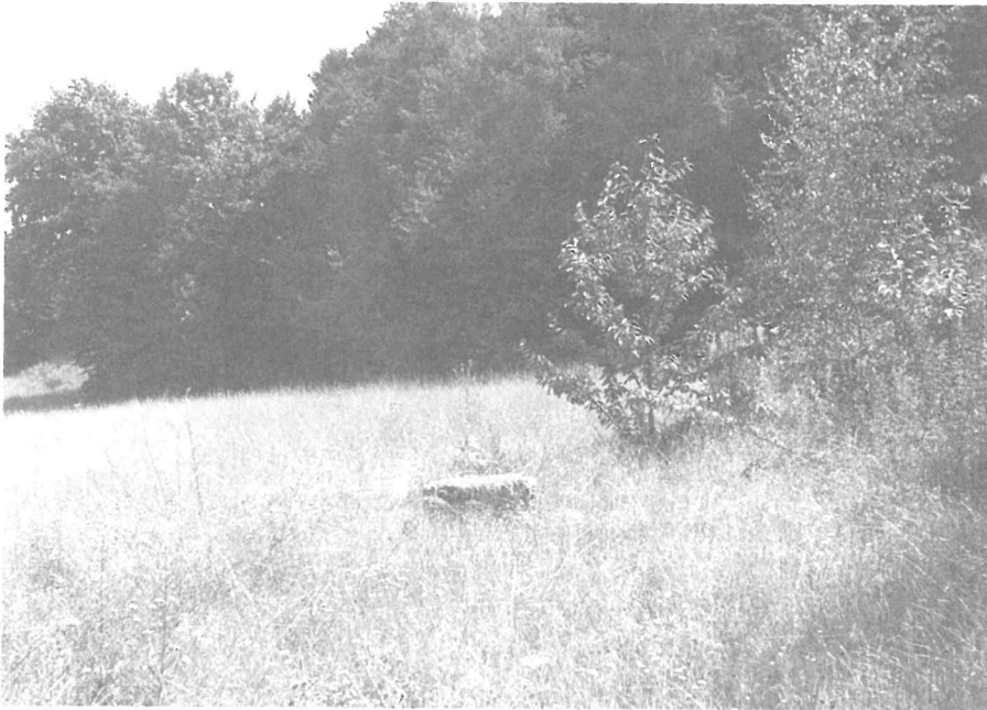
ALS BEIM LEHMABBAU in der kleinen Ziegeleigrube westlich des alten Dorfkerns Gostritz die Plänerschichten zutage traten, wurde er eingestellt. Seitdem siedelt auf diesen Flächen eine kalk- und wärmeliebende Flora und Fauna mit vielen Arten, die auf der sogenannten Roten Liste Sachsens erfaßt sind.