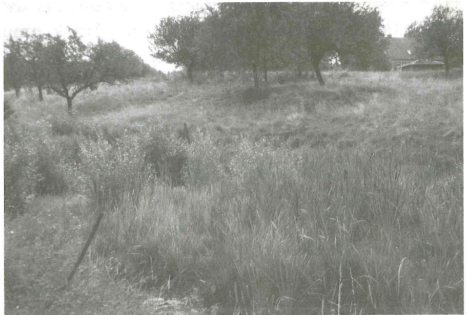
DER ANGER DES ALTEN DORFES BÜHLAU ist mit dem Teich und den umgebenden Wiesen in der Talmulde an der Quohrener Straße erhalten geblieben. Mehr als 80 Pflanzenarten wurden bisher auf den Wiesen registriert. Der Teich ist ein wertvolles Laichgewässer für Teichmolche und Erdkröten.

soll die untere Naturschutzbehörde in Kenntnis gesetzt werden.