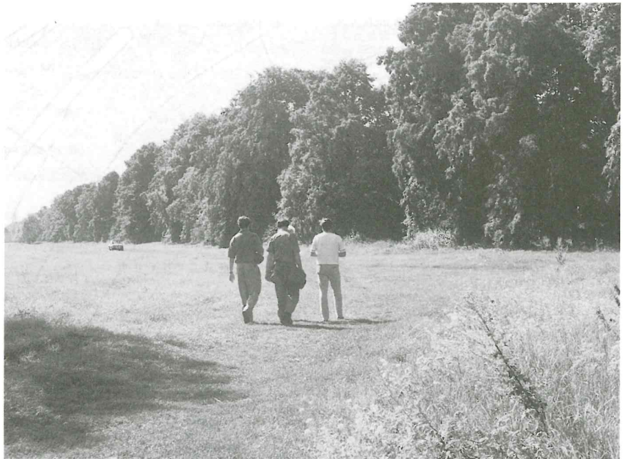
ALS LINDENALLEE ANGELEGT wurde um 1725 die Pieschener Allee, eine der ältesten Dresdner Alleen. Etwa 35 Bäume stammen noch aus dieser Zeit.

Sommerpreis/Galopprennen Dresdner Rennverein 1890 Rennbahn Dresden-Seidnitz Beginn: 14 Uhr