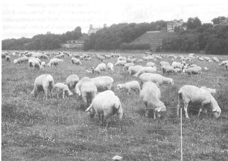
LÄNDLICHE IDYLLE fast mitten in der Stadt. Das Beweiden der Elbwiesen gehört in Dresden zur Pflege dieses Flächennaturdenkmals.