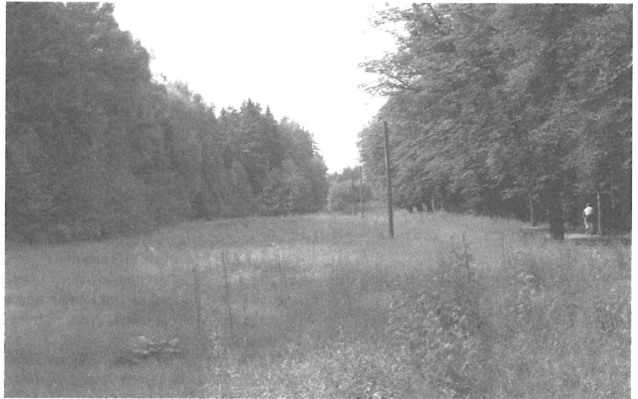
PARALLEL ZUR ALTEN ZWEI, einem Forstweg von Bühlau zum Saugarten, liegt die langgestreckte Rehwiese. Hierher kommt das Wild zum Äsen. Der artenreiche Bestand an Blütenpflanzen dieser Feuchtwiese dient zahlreichen Insektenarten als Nahrungsgrundlage.